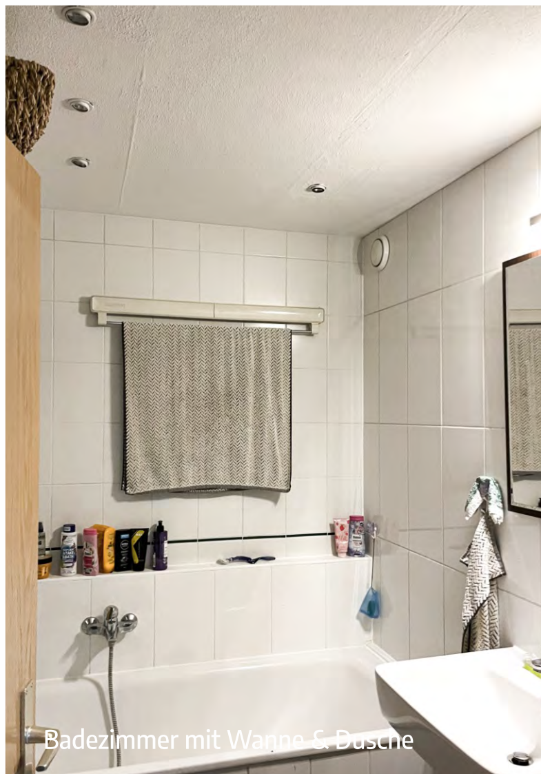
Badezimmer mit Wanne & Dusche